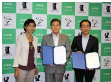
小平市「空家等対策に関する協定」締結式

空き家問題の解決には、自治体との連携が不可欠です。司法書士会では、多摩地域の各自治体に空き家問題対策協定の締結を働きかけております。すでに、小平市、小金井市、西東京市などと協定を締結しており、東村山市では締結に向けて協議中です。協定を締結した市においては、市民から相談に対して、スムーズなサポートができる体制が整備されています。