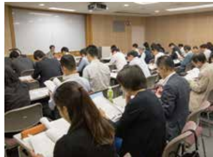
相続財産管理人研修の様相

空き家問題の原因の一つとされる、「相続人不存在」や「行方不明者」。そんな状況であっても司法書士なら相続財産管理人や不在者財産管理人として、空き家問題を解決に導くことができます。私たちはこれら財産管理人業務についての研修を毎年実施しています。研修履修者のうち希望者を「財産管理人（研修履修者）名簿」に登載し、東京家庭裁判所立川支部や、多摩地域の各自治体に提供しています。